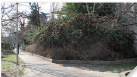
La proximité des écrans à remplacer imposera la fermeture ponctuelle du chemin piéton.

➤ Le site dirif.fr : pour se connecter au chantier