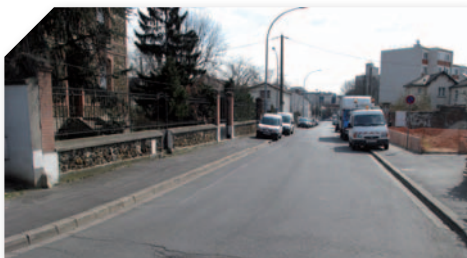
Dans certains cas, la circulation devra se faire sur la seule voie, par alternance gérée par des feux de chantier.

Consciente des désagréments que le chantier peut générer, la DIRIF s'efforce autant que possible de minimiser les nuisances des riverains. Elle met en place des dispositifs d'information pour prévenir usagers ou riverains au plus tôt.