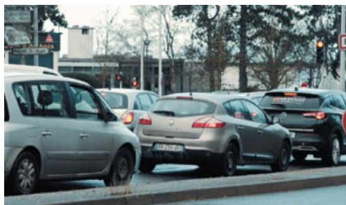
Trafic sur l'ancienne RN19 en traversée de Boissy-Saint-Léger

La mise en service de la déviation de la RN19 à Boissy-Saint-Léger permet de fluidifier le trafic et d'optimiser les déplacements. C'est aussi le moyen d'apaiser la circulation à Boissy-Saint-Léger en reportant en dehors du centre-ville le trafic de transit qui empruntait initialement l'avenue du Général Leclerc (ancienne RN19).