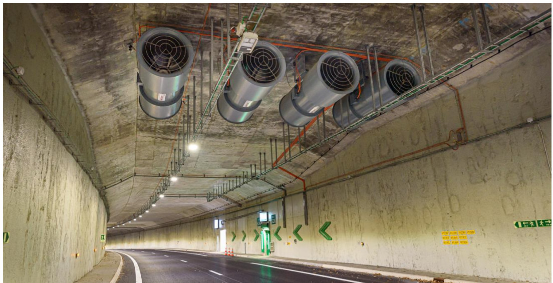
Accélérateurs pour la ventilation