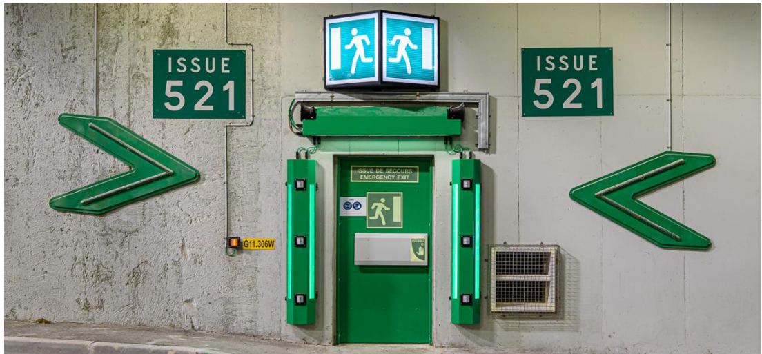
Issue de secours